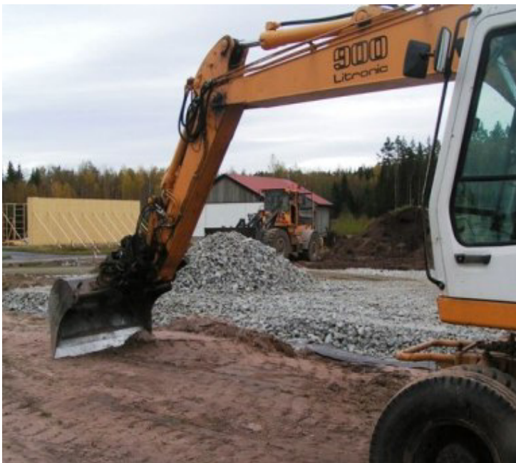
Schröders har under sommaren fixat vägar och platser för grunderna.