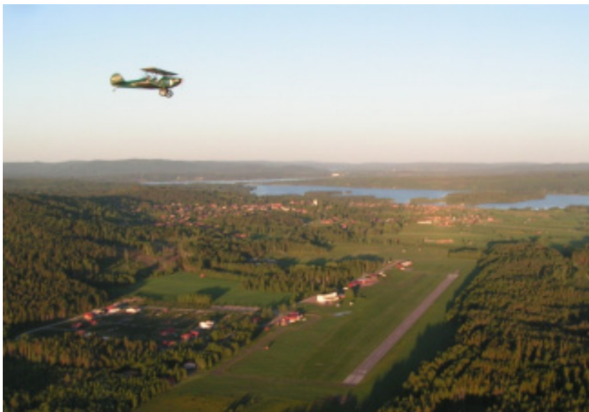
Härlig sommarkväll över Siljan AirPark.