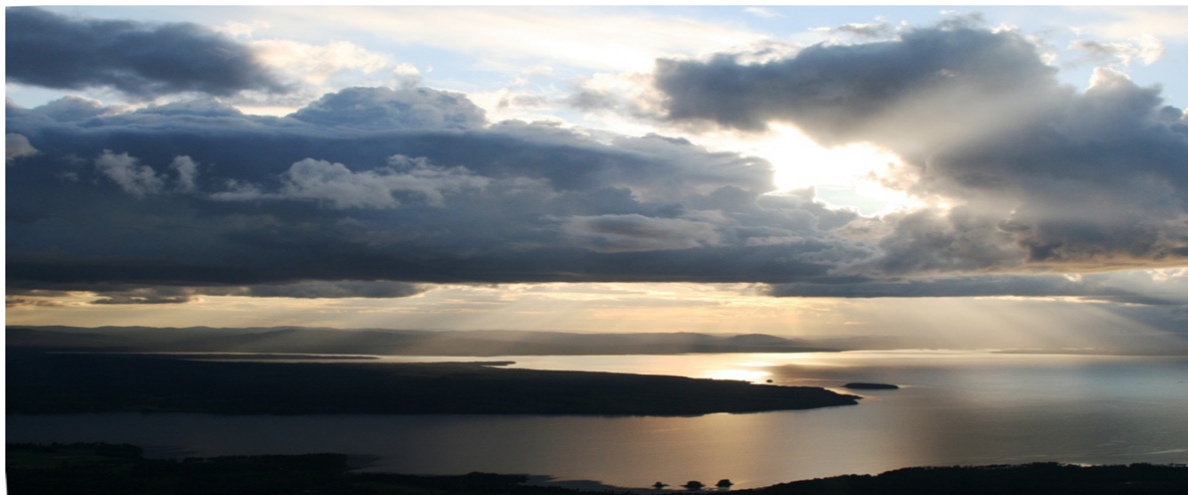
Siljan AirPark 10 km bort vid vä bildkant. Tällberg under, Mora bortom hö bildkant.