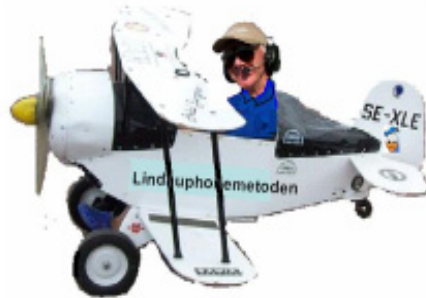
Skolning enligt "Linduphone-metoden" kan tillämpas även inom flyget, föreslår fotograf och manipulator Göran C.