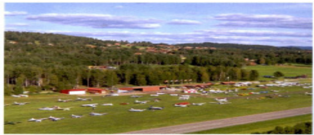
Eftermiddagsbild över Siljansnäs.