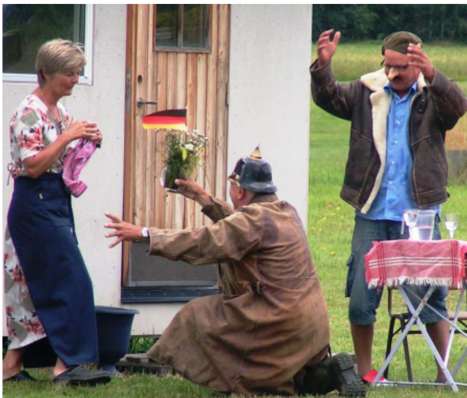
Kullan Ingrid, Baron Bo Sommerfugl-Schmetterling VII och Monsieur LaFleur i triangeldrama.

2012 års temautställning kommer att bli Ballongflyg. Nya föremål kommer att ställas ut. Det mesta blir kvar som tidigare och vi har som alltid begrän-