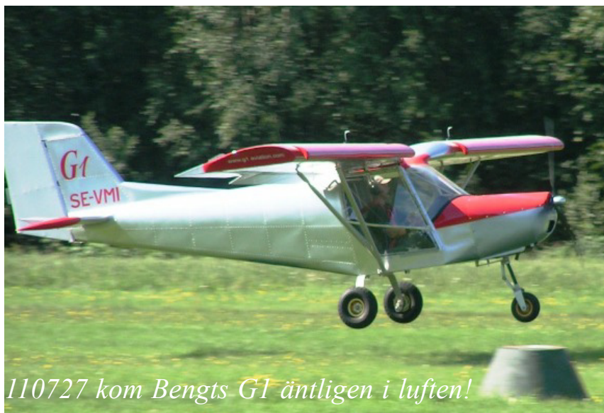
110727 kom Bengts G1 äntligen i luften!

Efter mycket trassel med flygtillstånd har min G1 äntligen fått ”egna vingar”: allt är OK! Jag har flugit runt i siljanskommunerna, men även en längre tur bör hinnas med i höst. Fram med kartan för att kolla flygfält lite längre bort.