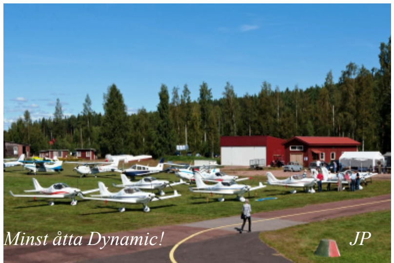
Minst åtta Dynamic!

Utländska registreringar var det som vanligt gott om: LN 10 st, OH 8 st, OY 2 st, D 2 st och HB 1 st, dessutom Slovenien, OY och LN i ”byn”.