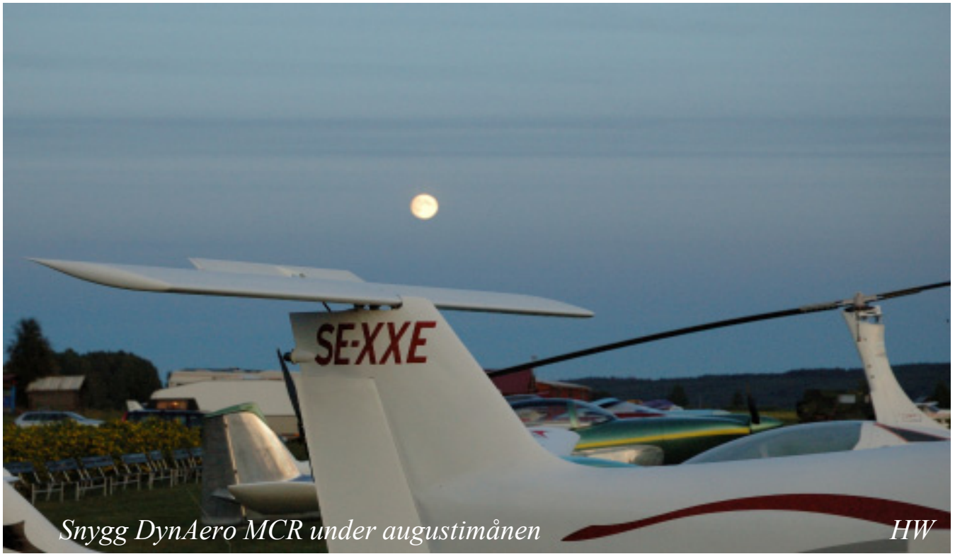
Snygg DynAero MCR under augustimånen