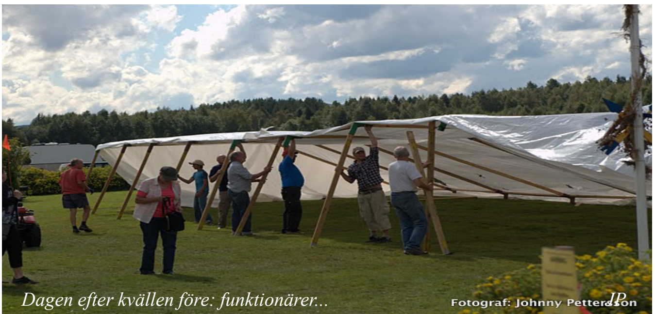
Dagen efter kvällen före: funktionärer...