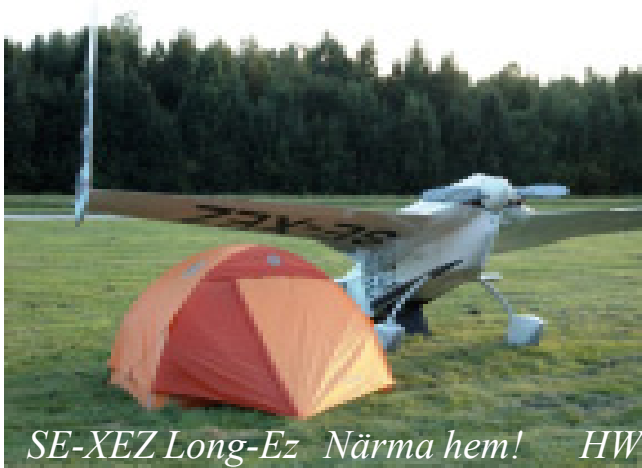
SE-XEZ Long-Ez Närma hem! HW