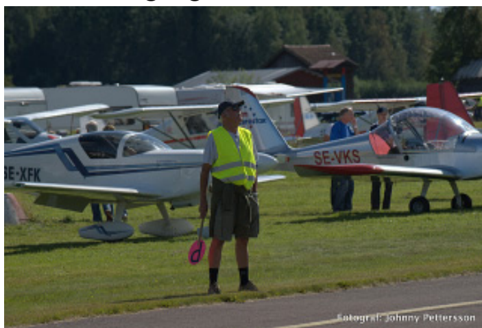
Flygplansrangerare OY-STIG H.