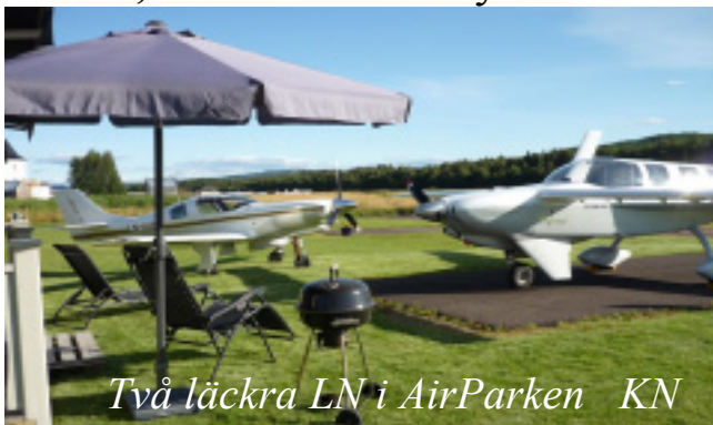
Två läckra LN i AirParken KN