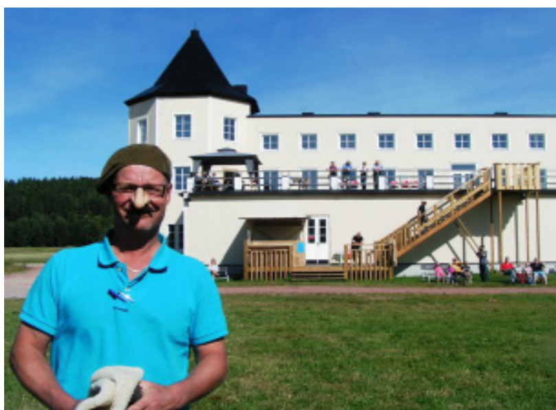
Monsieur LaFleur utklädd till Carl Rönn.

Om och när isen lägger sig och om vi får ihop det med organisation och finansiering så flyger vi. Tänk er en vacker vinterdag när man kan se precis hur långt som helst i klar luft och en färggrann luftballong med glada aviatörer över Siljan: En positiv upplevelse, inte bara för oss utan hela regionen!