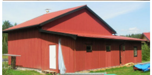
Knut har kompletterat hangaren med verkstad och övernattningsrum.