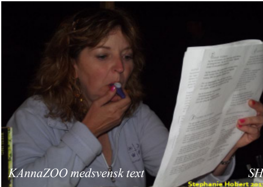
KannaZOO medsvensk text