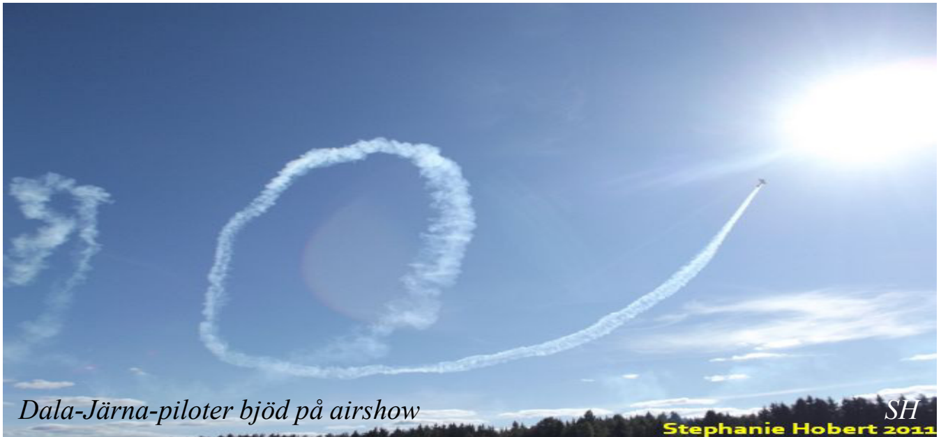
Dala-Järna-piloter bjöd på airshow