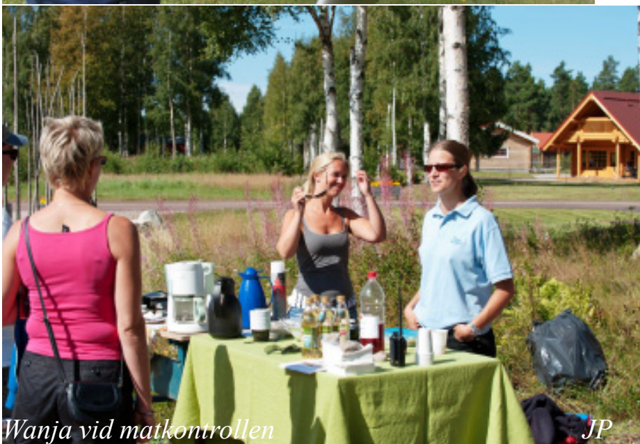
Wanja vid matkontrollen

Lägg därtill ca 15 flygplan som stod hemma i AirParken som livgivande dekorationer inför den snitslade "Walk Around Safarin" runt flygbyn med infoskyltar och en lättare frågesport. Vid målgången bjöd byinvånarna och Stockmos på AirPark Cider och våfflor.