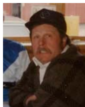
Bosse på 50-årsdagen