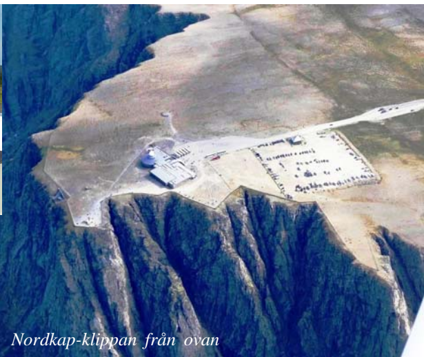
Nordkap-klippan från ovan

Skönt att få frilägga pedalerna i gräset framför klubbstugan i Siljansnäs.