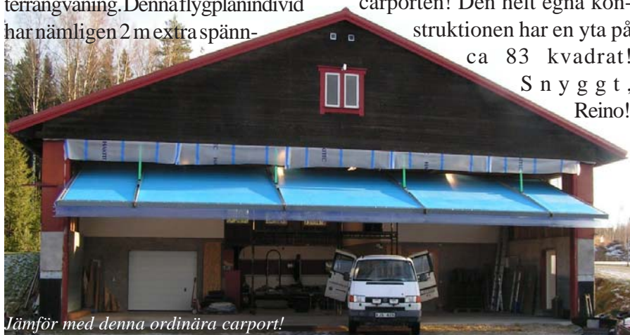
Jämför med denna ordinära carport!